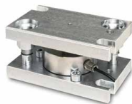
Abb. zeigt Zubehör Lastecke 1 SAUTER CE Q42901, weiteres Zubehör im Webshop